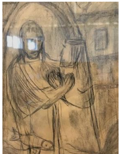
Tekening 1 van Hilje Groeneveldt

Het bekende 'Erbarme Dich' uit de Matteüs Passion vertolkt misschien wel wat door hem is heen gegaan, een haan kraaide. Het voelt zo herkenbaar.